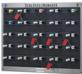
565025B mit Blindleiste