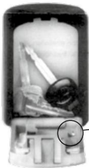
Abbildung 1: Lage Reset-Knopf