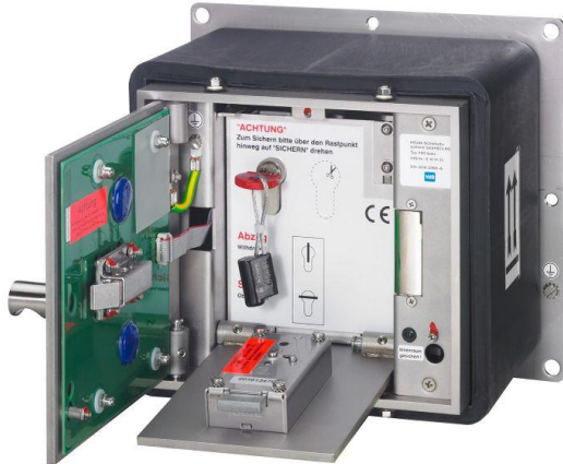
Verbaute Anschlussplatine (Baujahr)