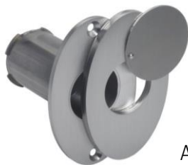
Abb. 1: Frontplatte verschieben